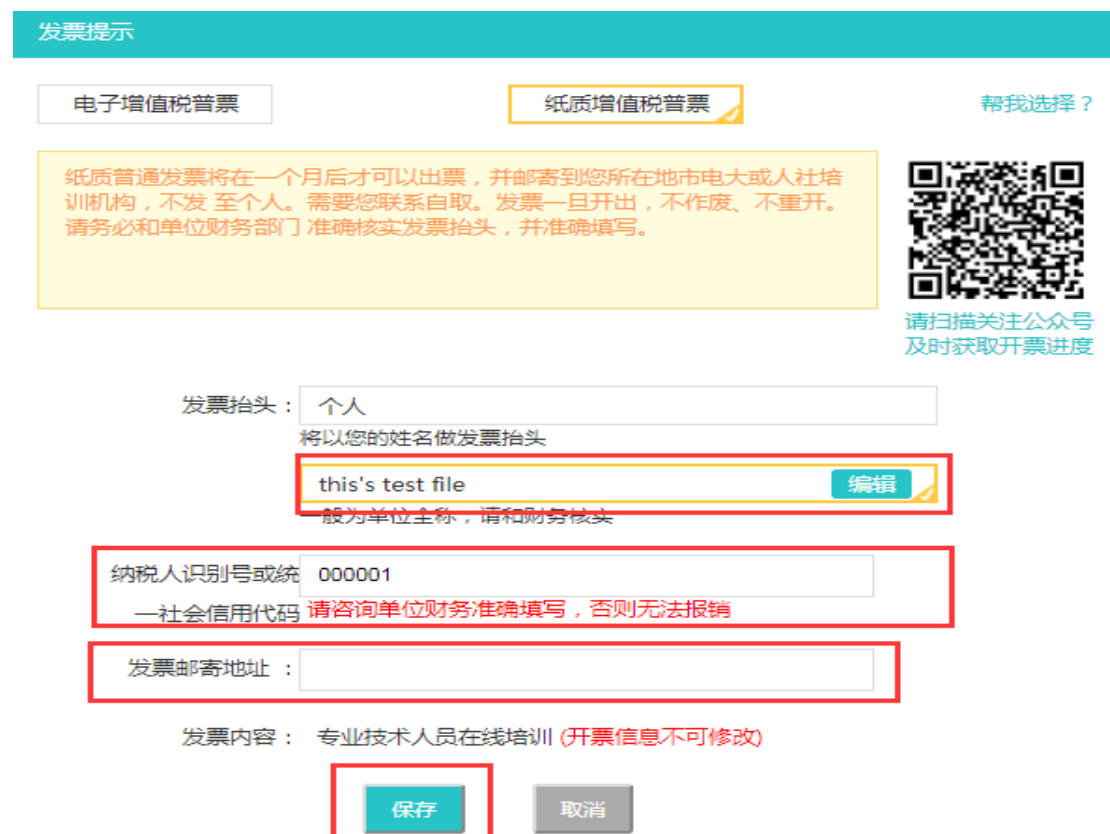
图 2-28 填写发票邮寄地址