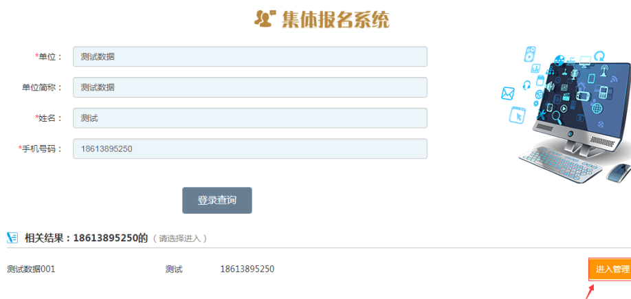
图 2-2 集体报名查询结果