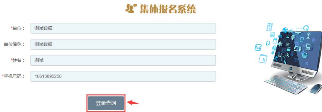
图 2-1 集体用户报名登录查询