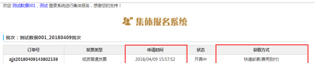
图 2-31 纸质发票