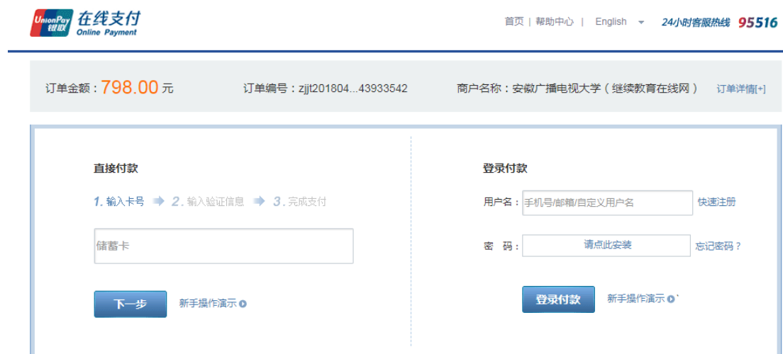
图 2-18 根据页面引导完成支付

4、若支付失败返回支付页面，页面提示“订单支付异常！无法交易”，如图 2-19 所示。