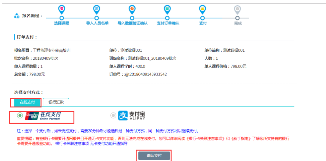
图 2-17 确认支付方式