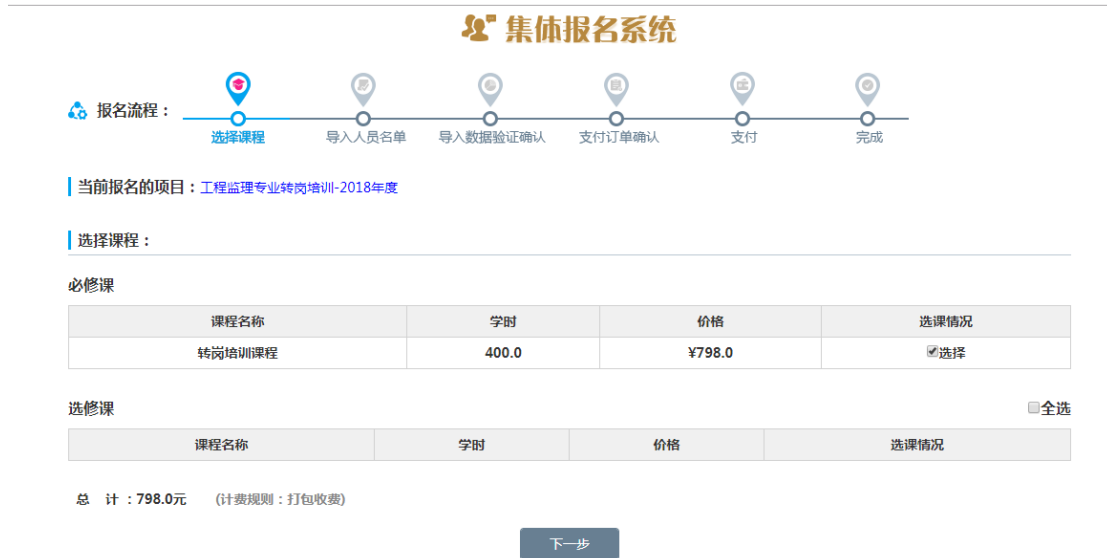
图 2-6 进入选择课程页面