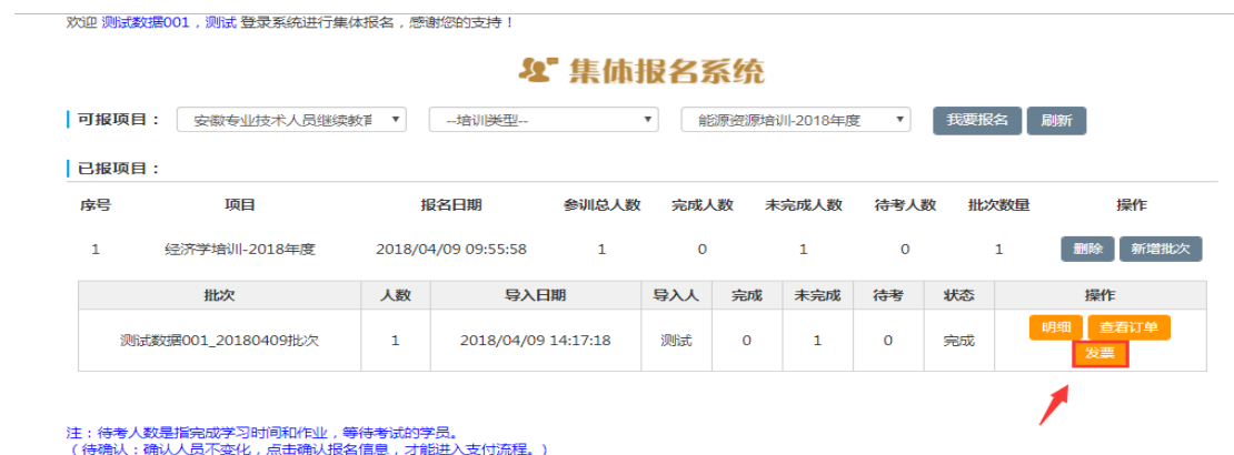
图 2-24 查看发票页面

2、进入发票详情页面, 点击“申请发票”, 如图 2-25 所示, 进入开票界面, 如图 2-26 所示。