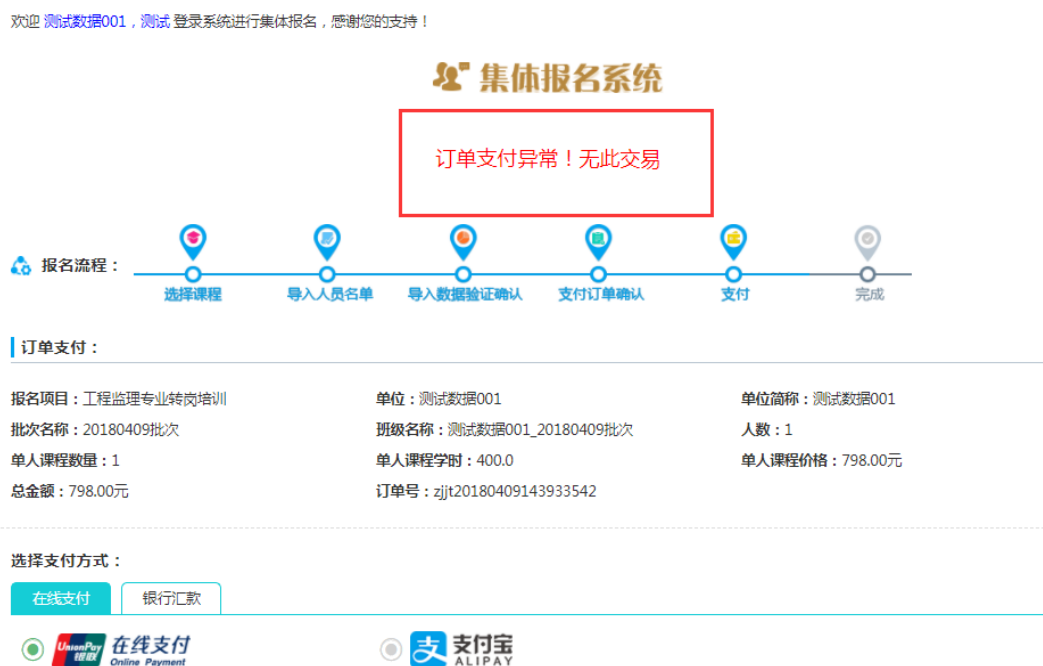
图 2-19 支付异常情况

4、若支付失败返回支付页面，页面提示“订单支付异常！无法交易”，如图 2-19 所示。