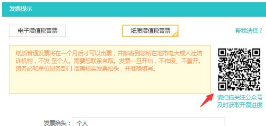
图 2-30 扫一扫了解开票进度