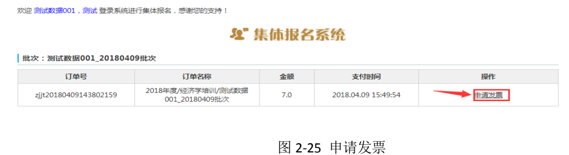
图 2-25 申请发票

2、进入发票详情页面, 点击“申请发票”, 如图 2-25 所示, 进入开票界面, 如图 2-26 所示。