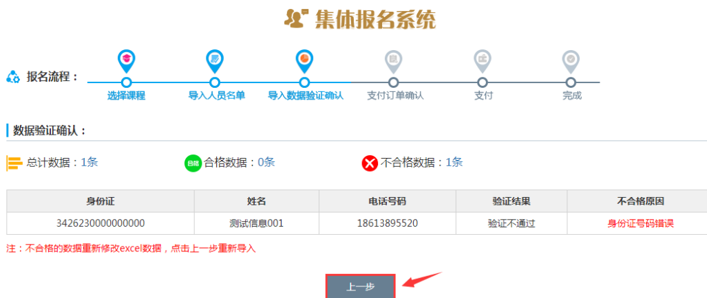
图 2-13 修改验证不通过的数据