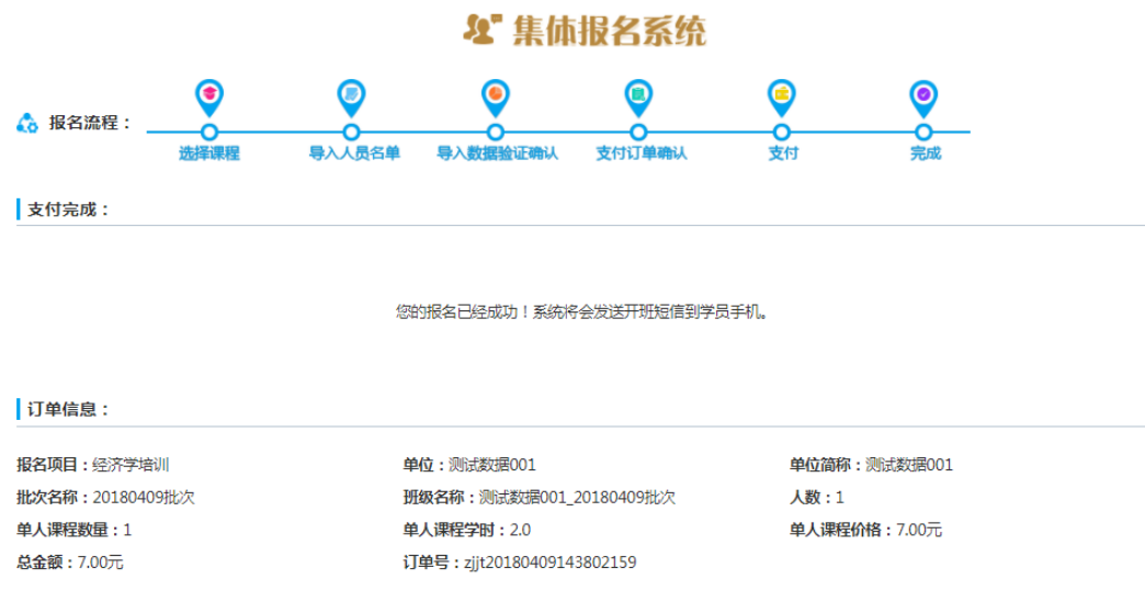
图 2-22 支付完成提示

【安徽专技在线】测试数据001学员 您好，测试数据001已为您开通了工程 监理专业转岗培训(2018年度)项目的 学习，请登录安徽专技在线 ( http://www.zjzx.ah.cn )学习，用户 名:3426231[REDACTED]，初始密 码： 031217 ，祝您学习愉快！