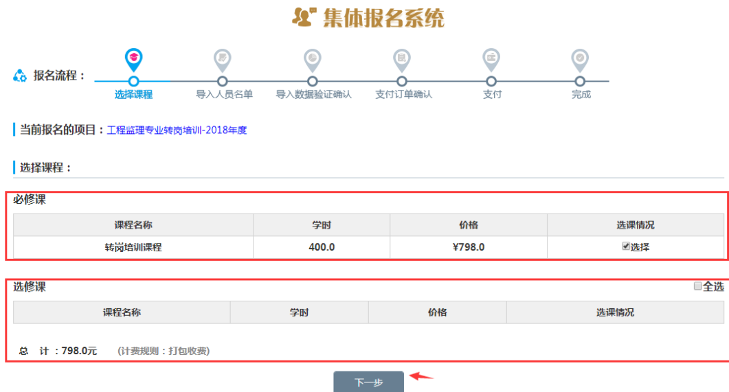
图 2-7 选择课程页面