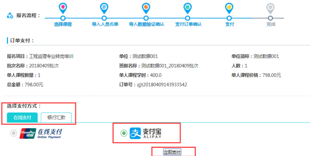
图 2-20 选择支付宝支付