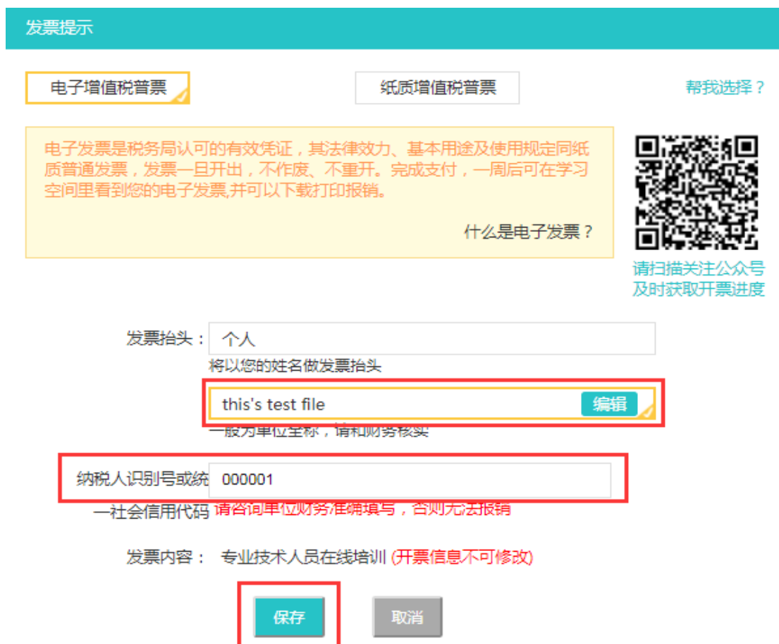
图 2-27 发票填写类型

“单位全称”及填写“纳税人识别号或统一社会信用代码”，点击“保存”即可，如图 2-27 所示。