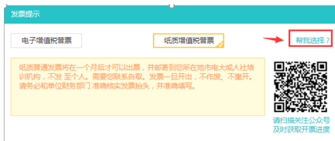
图 2-29 点击“帮我选择”