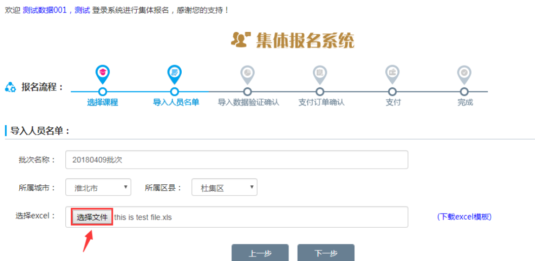
图 2-11 上传学员 excel 文件