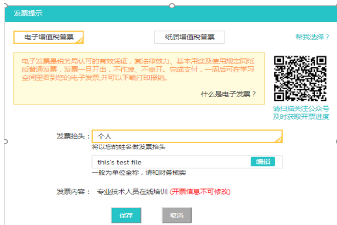
图 2-26 选择发票类型

3、发票分为“电子增值税普票”及“纸质增值税普票两种”。“电子增值税普票”, 可编辑