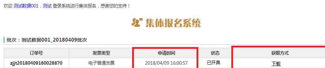
图 2-32 电子发票