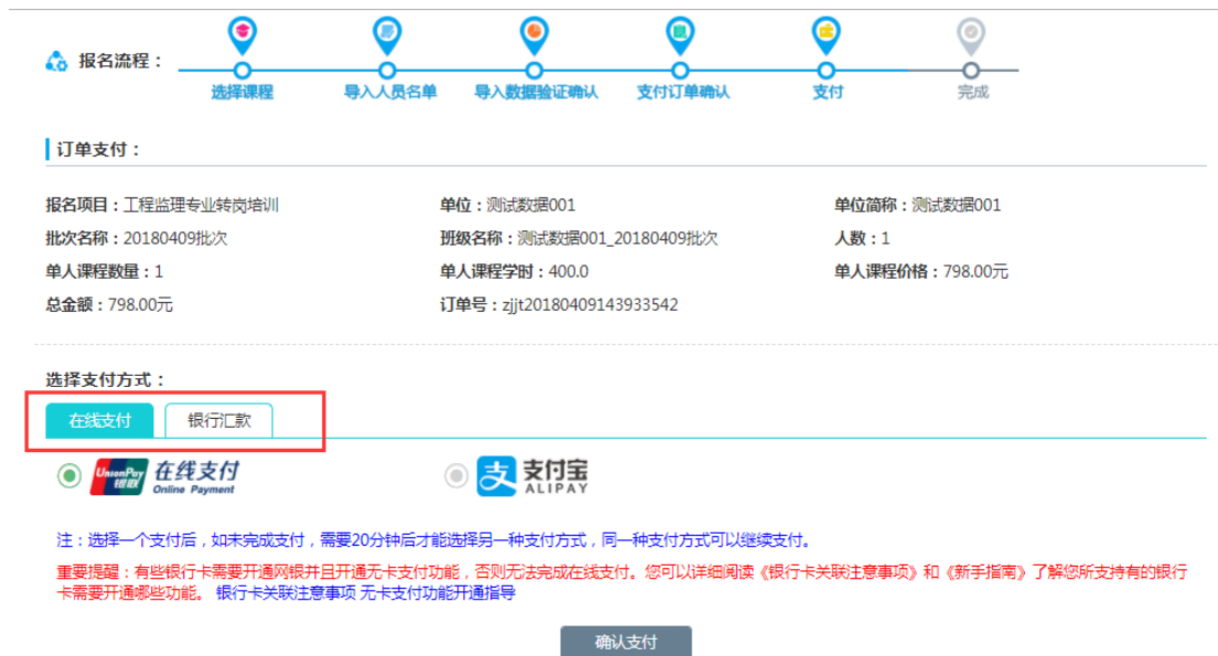
图 2-16 选择支付方式

2、在线支付为：“在线支付”和“支付宝”，选择“在线支付”点击“确认支付”，如图 2-17