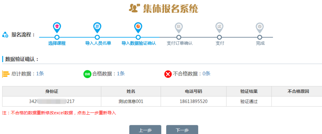
图 2-12 验证导入学员信息

6、导入数据验证不通过如图, 点击上一步, 返回导入人员名单, 重新修改后再进行下一步, 如图 2-13 所示。