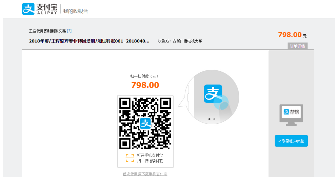
图 2-21 支付宝支付界面

7、支付成功后用户将会收到报名成功提示，如图 2-22 所示，及学习短信，如图 2-23 所示。